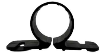
COLLIERS DE SERRAGE OMEGA

Dimensions disponibles : 1/2 po, 3/4 po et 1 po Référence de la liste de prix : Catégorie 781