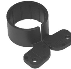
COLLIERS DE SERRAGE ALPHA